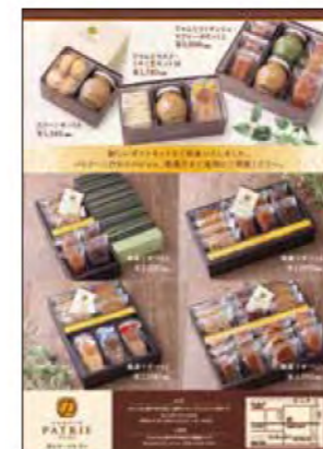
オープニングちらし