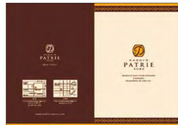
ブランドパンフレット