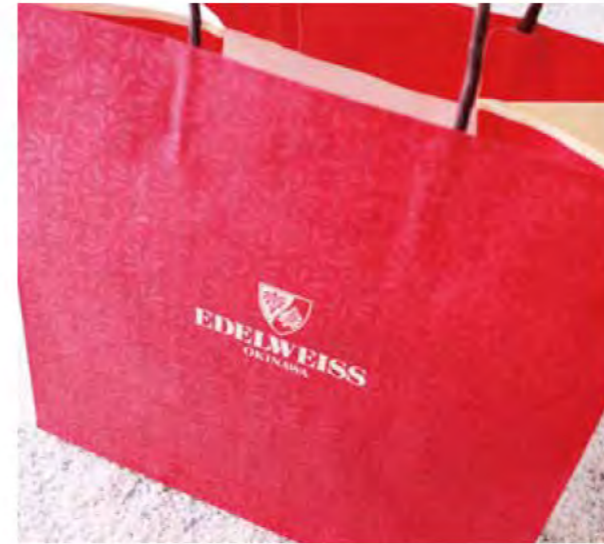
ショッピングバッグ