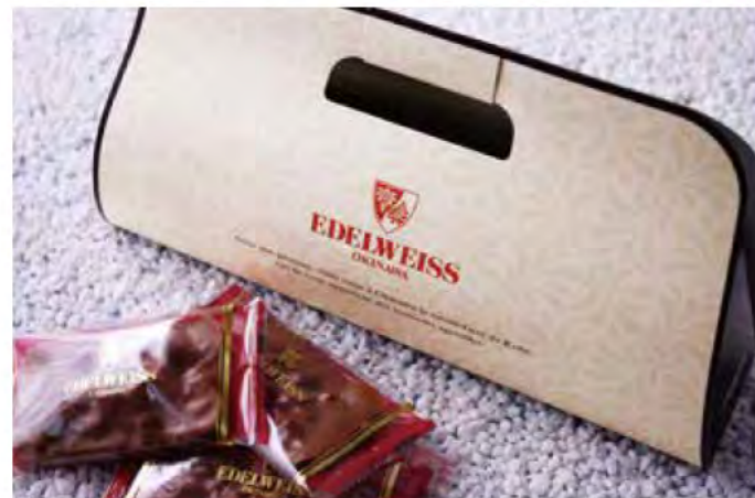
ギフトパッケージ