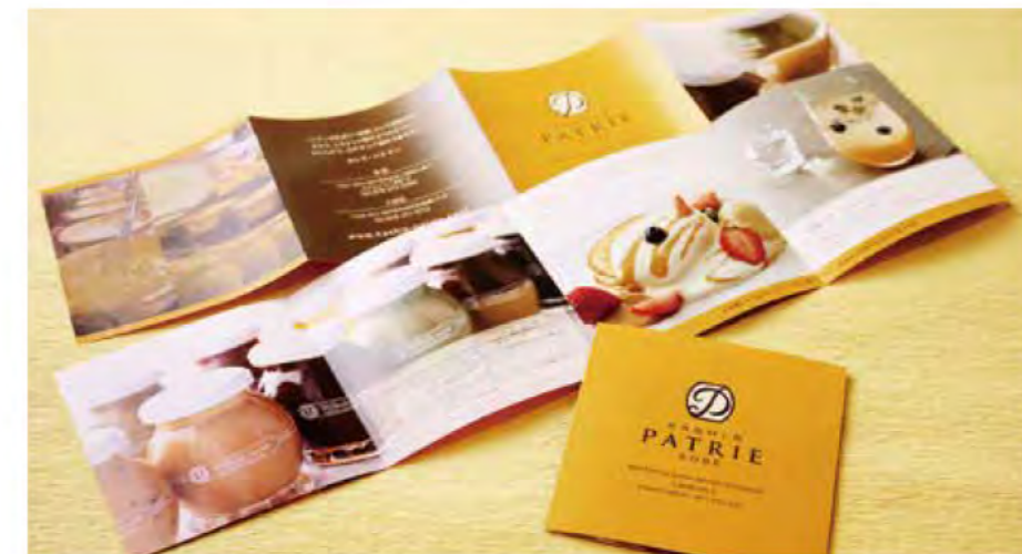
商品リーフレット