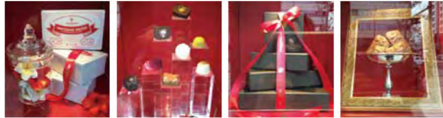
ウィンドウディスプレイ

「デイゴ」をあしらったギフトパッケージやショッピングバッグ。 ウィンドウディスプレイやギフトGケースのディスプレイも エーデルワイス沖縄の「エスプリ」を伝えています。