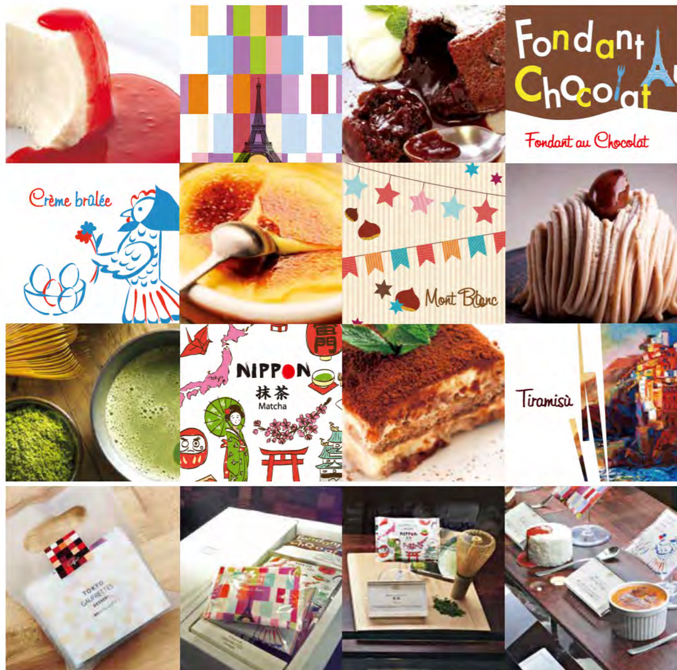
ショーケース内ディスプレイ

誕生から約50年、国民的銘菓、東京風月堂の「ゴーフレット」が新宿伊勢丹様との開発期間を経て、2015年春、大リニューアルを実現しました。