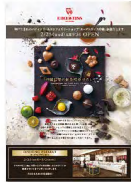
オープニングちらし