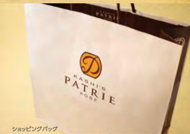
ショッピングバッグ