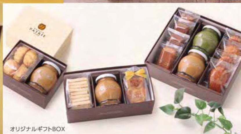
オリジナルギフトBOX